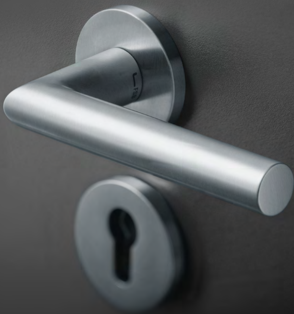
Türdrücker-Modell FSB 1076 in Edelstahl fein matt gebürstet 6204